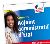
Ouvrages de préparation complète à toutes les épreuves d'un concours !